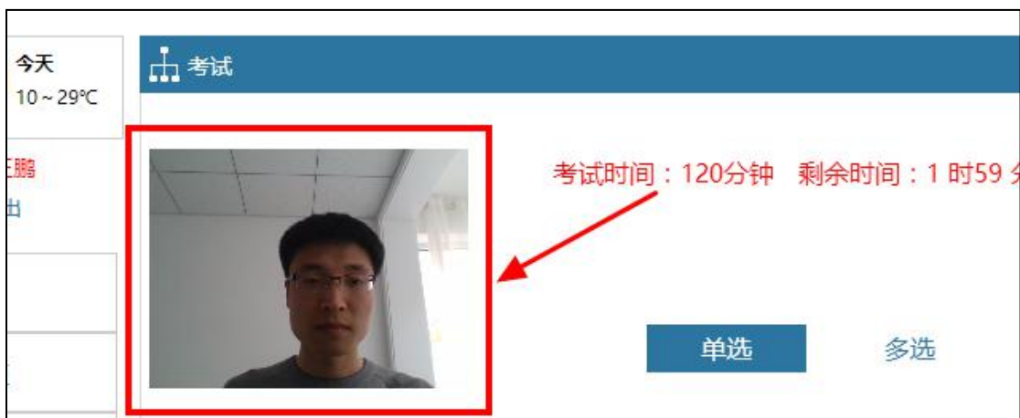
图 3-23 已显示正确头像信息