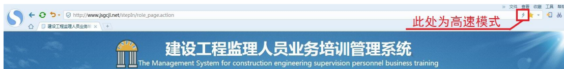
图 2 搜狗浏览器的高速模式