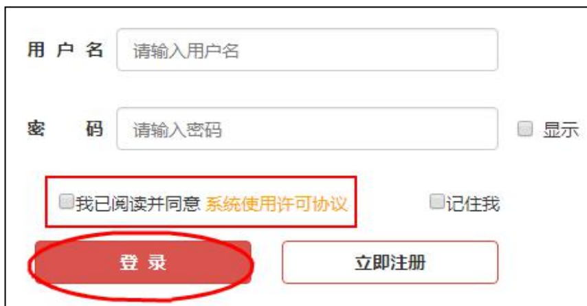
图 3-4 企业登录

1.企业注册成功后，进入企业登录界面，输入“用户名和密码”，阅读“系统使用许可协议”后，单击“登录”按钮，进入系统。如图 3-4。