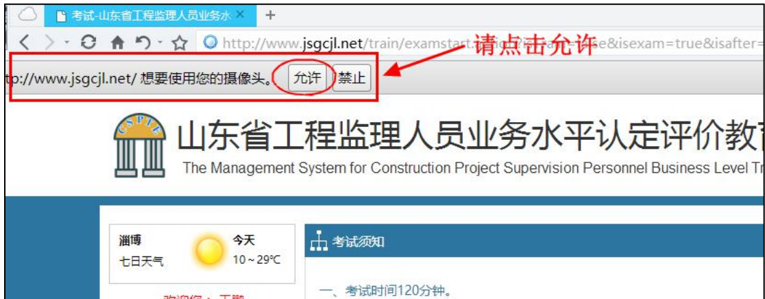
图 3-21 360 浏览器调用摄像头的调用提示

3. 点击“进入考试”后，再次出现“摄像头调用”提示，请确保已“允许”浏览器调用摄像头。若“实时录像区域”区域能显示正确头像信息，点击“确定”继续进行考试；若不能显示正确头像信息，请在摄像头调用成功后再进行考试，否则将影响考试结果，摄像头的调用按照上一界面的操作方式进行。如图 3-22、图 3-23 所示。