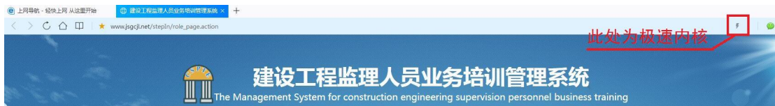
图 3 QQ 浏览器的极速模式