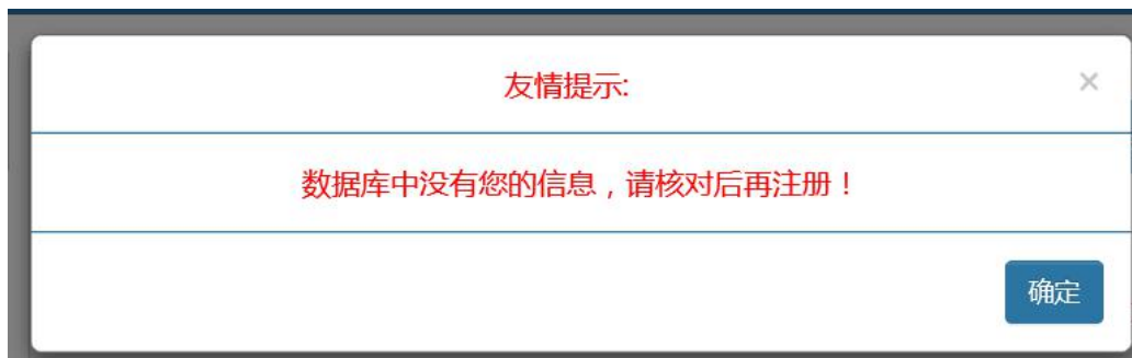
图 3-7 新增人员信息与数据库信息比对不成功