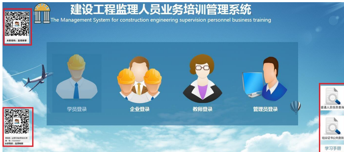
图 3-1 网站首页