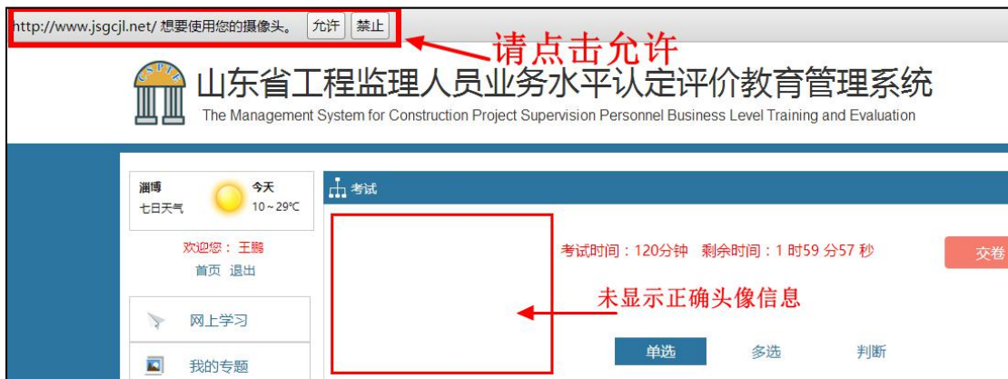
图 3-22 未显示正确头像信息

3. 点击“进入考试”后，再次出现“摄像头调用”提示，请确保已“允许”浏览器调用摄像头。若“实时录像区域”区域能显示正确头像信息，点击“确定”继续进行考试；若不能显示正确头像信息，请在摄像头调用成功后再进行考试，否则将影响考试结果，摄像头的调用按照上一界面的操作方式进行。如图 3-22、图 3-23 所示。