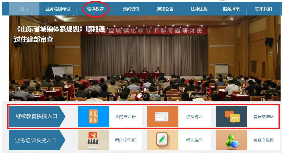
图 3-15 学习首页