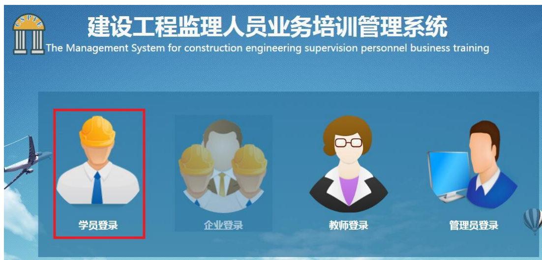
图 3-12 网站首页

1.打开系统推荐的浏览器，输入地址“http://www.jsgejl.net”，进入“建设工程监理人员业务培训管理系统”网站首页，点选“学员登录”后进行地区选择。如图 3-12 和图 3-13。