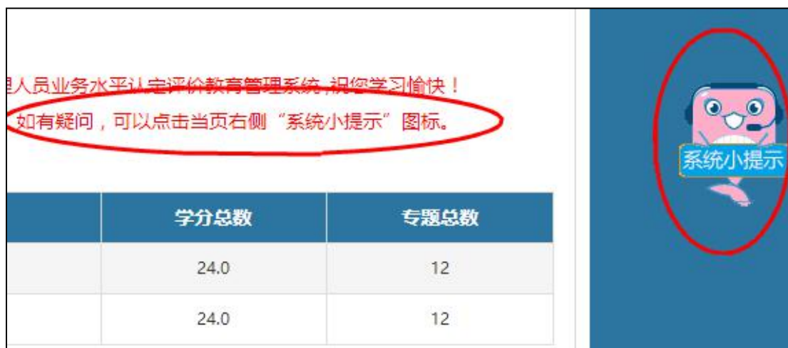
图 3-18 系统小提示

6.系统小提示，每个页面的右侧都会有一个“系统小提示”，记录了当前页面的学习过程中最常见的问题，方便学习，界面友好。如图 3-18。