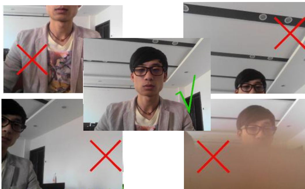
图 3-24 摄像头使用实例

4.考试过程中请确保个人的头像处于摄像头窗口中，调整摄像头角度以满足拍照要求，若所拍照片中没有正确头像信息，则考试成绩作废。如图 3-24。