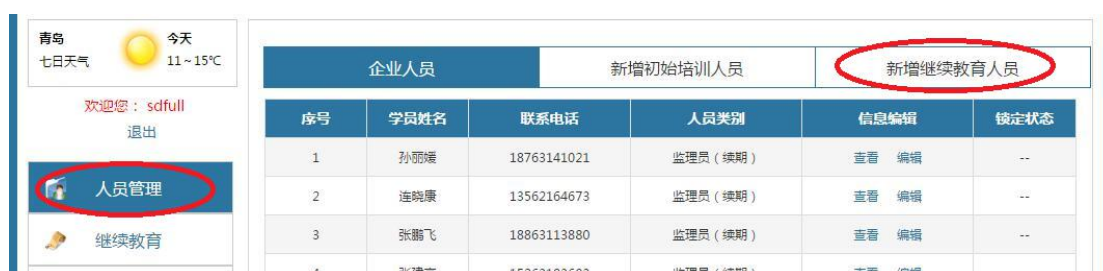
图 3-5 新增人员

2.登录成功进入系统，在左侧菜单栏“人员管理”中，单击“新增继续教育人员”，填写并上传员工信息。如图 3-5。