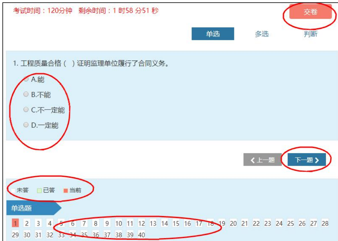
图 3-25 考试界面