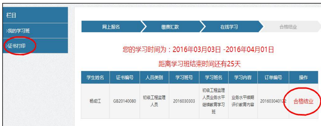
图 3-26 证书打印界面

当结业考试成绩合格后，可以回到导航栏“继续教育”模块，点选左侧菜单栏的“证书打印”或者我的学习班列表中的“合格结业”操作，进行继续教育结业证书的打印，作为本次继续教育合格的证明。注意：对于学员个人而言，本次学习结束，等待企业提交续期申请。如图 3-26。