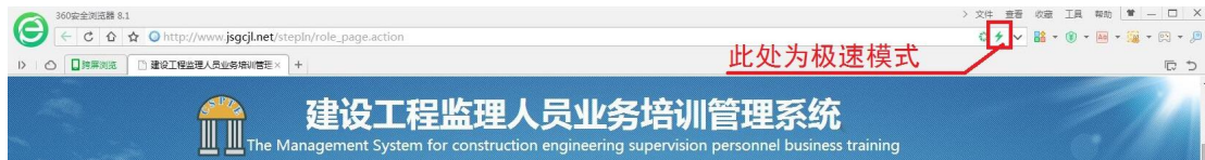
图 1 360 浏览器的极速模式

建议使用 谷歌浏览器 、360 浏览器（极速模式）、搜狗浏览器（高速模式）、QQ 浏览器（极速内核）、IE10 以上（含 IE10）浏览器等。如图 1、图 2、图 3 所示。