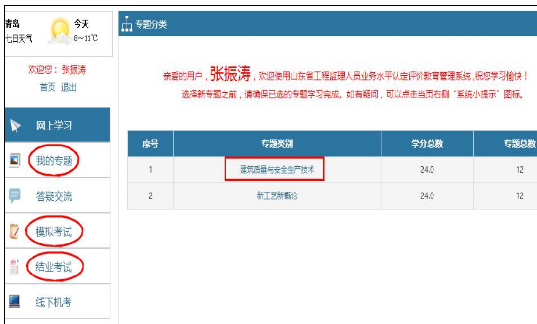
图 3-17 专题学习界面

6.系统小提示，每个页面的右侧都会有一个“系统小提示”，记录了当前页面的学习过程中最常见的问题，方便学习，界面友好。如图 3-18。