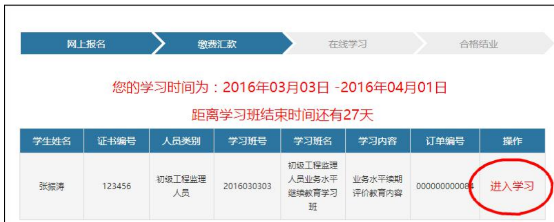
图 3-16 我的学习班

5.在专题学习界面，可点选右侧“专题类别”中的课程名，比如“建筑质量与安全生产技术”，进入专题视频列表选择相应的视频进行学习，每个专题视频学习完成后，会出现“黄色笑脸”的提示，若视频结束仍未出现笑脸提示，请在QQ群内进行咨询。如图 3-17。